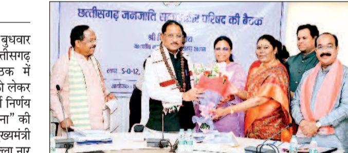
छत्तीसगढ़ जनजातीय सलाहकार परिषद की बैठक

मुख्यमंत्री श्री साय ने कहा कि बस्तर, जो भौगोलिक रूप से केरल से भी बड़ा क्षेत्र है, दशकों तक विकास से वंचित रहा, लेकिन अब वहां योजनाओं का तीव्र विस्तार हो रहा है और विकास की नई धारा स्थापित हो रही है। जनजातीय संस्कृति और परंपराओं के संरक्षण को सर्वोच्च प्राथमिकता देते हुए देवगुड़ी और सरना स्थलों की सुरक्षा सुनिश्चित करने के निर्देश दिए। साथ ही अवैध अतिक्रमण को रोकने के लिए प्रभावी और कड़े कदम उठाने पर जोर दिया। उन्होंने बताया कि "धरती आबा ग्राम उत्कर्ष योजना" के माध्यम से प्रदेश के 6600 गांवों में शिक्षा और स्वास्थ्य सुविधाएं सुदृढ़ की जा रही हैं, जबकि पीएम जनमन योजना के अंतर्गत 32 हजार आवास स्वीकृत किए जा चुके हैं।