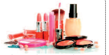
शादी फंक्शन में चार चांद लगाने समर ...